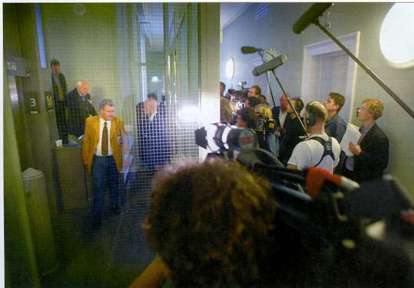
3 oktober. De verzamelde parlementaire pers op de derde verdieping van gebouw Koloniën: wachten op LPF-kopstukken

de derde verdieping van Koloniën net als dinsdag vol met pers. Overall halflege koffiebekers. De as is in het tapijt getrapt. Camera-mensen dringen de kamers van de fractieleden binnen, zetten de TV aan en kijken hoe hun beelden worden uitgezonden.